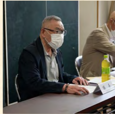
議長を務められた1区西澤班長さん