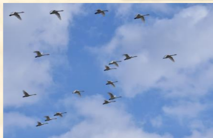
田んぼに着陸直前の飛行隊、リーダーの掛け声でやってきました。