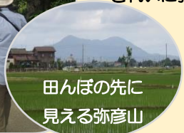
田んぼの先に見える弥彦山