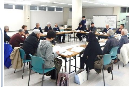
組織検討会の様子

「皆さんのやる気がひしひしと感じられた」 「今日を終え、きっと素晴らしいコミュニティになると実感した」 「具体的になり楽しみです」 ~委員さんの感想より~