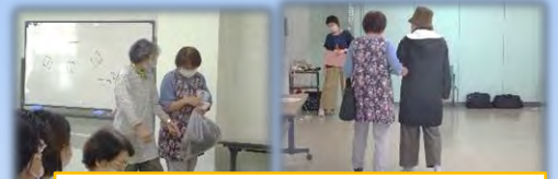
キャラバンメイトさんによる寸劇

9月5日(日)にも認知症サポーター養成講座を予定しておりましたが、コロナウイルスの感染が拡大している状況を受け、残念ながら中止とさせていただきます。参加希望されていた方には急な中止連絡となり、申し訳ございませんでした。