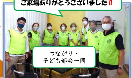
つながり・子ども部会一同