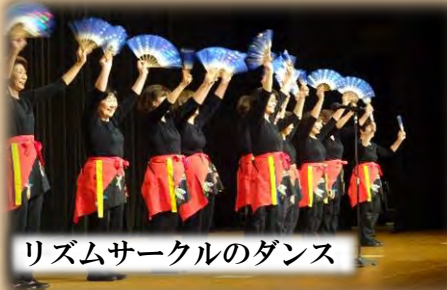
リズムサークルのダンス