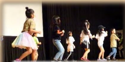
ダンススタジオ・サンデイの 子供達のダンス