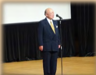
来賓挨拶・久住見附市長