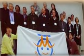
ビデオレター上映