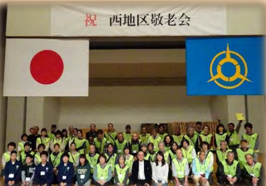
敬老会終了後、役員・委員・ボランティアの皆さんで集合写真