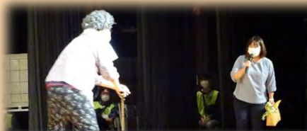
見附健康福祉課・認知症予防のお話と チームオレンジの寸劇