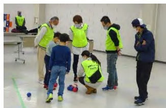
ニューススポーツ体験