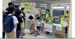
開場前から40名近くの方が並ばれていました

8月27日(日)4回目となる「ふるほん市」をネーブルみつけ多目的広場にて開催しました。両手いっぱい本を抱えて帰られる方がたくさんいらっしゃいました。当日は、200名を超える方にご来場いただき、ありがとうございました。ご協力いただいた、委員の皆さんお疲れ様でした。