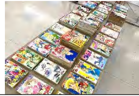
事前に寄贈していただいた本は3,600冊