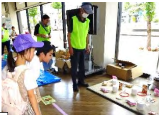
こども広場は、開始と同時にたくさんのお子さんが参加してくれました。