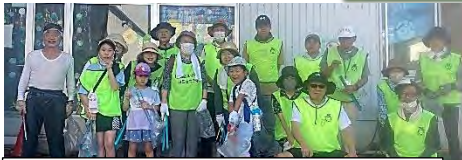
お子さんも、元気いっぱい、参加してくれました。

8月20日、9月17日に「安全安心パトロール兼ゴミ拾い」を実施しました。両日ともに午前8時のスタート時点で気温が上昇していた為、パトロールコースを短縮して実施しました。これからも、参加者の皆様の体調や天候等、考慮しながら実施していきたいと思えます。ご参加いただきありがとうございました。